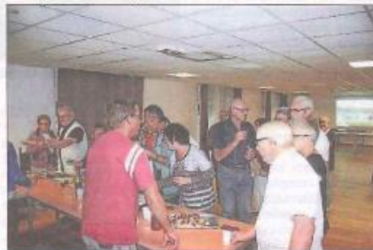
ZAu relais du terroir et sa quiche maison