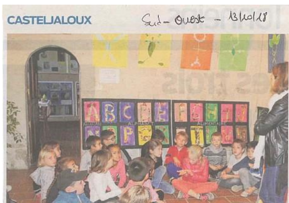
La classe de CE2 de Samazeuilh et leur enseignante.