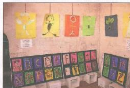
L'école de Samazeuilh et de la Réunion (en bas)