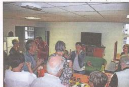
La ferme de Lafitte et ses produits fermiers