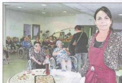
Dégustation des produits de la ferme de Lafitte à l'EHPAD de Casteljaloux

Dès 8 heures 30, les nombreux exposants présents ont accueilli les visiteurs venus en nombre pour se dé-