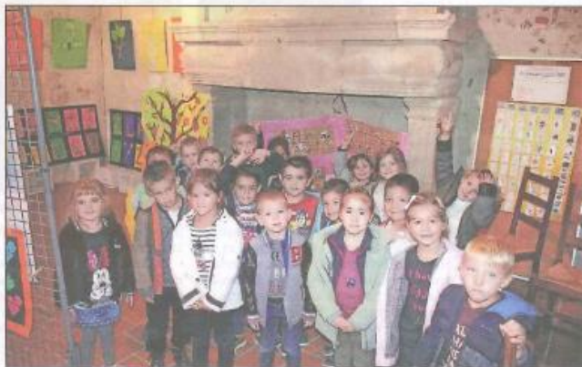
Les maternelle de Jean de la Fontaine visitent l'exposition

Dès lundi il était possible d'admirer les œuvres réalisées dans le cadre de la Semaine nationale du goût qui s'est déroulée la semaine dernière. L'Office de Tourisme a proposé un concours d'art plastique sur le thème : "Le goût au rythme des quatre saisons" à toutes les écoles primaires de la Communauté des Communes. Une douzaine de classes ont participé à cette opération et les œuvres réalisées, par les enfants des écoles de Casteljaloux (Primaires et maternelles de Samazeuilh, et La Salle Sainte Marie, Jean de la Fontaine, et de la crèche multi-accueil des lutins) et de l'école primaire de la Réunion sont exposées depuis lundi dernier à la salle de la Maison du Roy. Elles seront visibles aux heures d'ouverture de