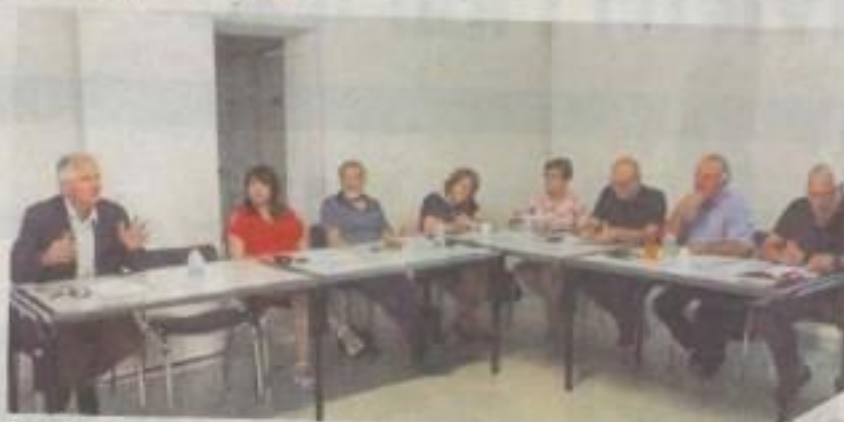
L'office de tourisme des Coteaux et Landes de Gascogne au centre Jean-Monnet.