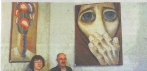
Peintures andines à la Maison du Roy.

Exposition visible jusqu'à samedi, à la Maison du Roy.