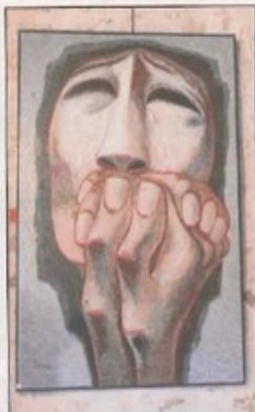
Un tableau très expressif

contre lors d'un voyage en Espagne, et séduit par ses œuvres, il organise une exposition à Marmande. Ce sera sa première exposition en France et depuis 2004, il participe à de nombreuses expositions dans l'hexagone. Il sera admis membre de l'académie des «Arts-Sciences-