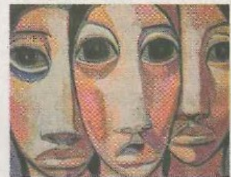
Une des œuvres de l'artiste peintre

la vieille douleur inassouvie de l'Indien sud-américain de toute la sourde clameur d'un peuple opprimé depuis des siècles. L'impact dramatique de l'œuvre de Murrugarra est compensé par la tendresse et la douceur de sa palette riche en lumière. Sa peinture parle. L'exposition se prolongera jusqu'au 22 avril.