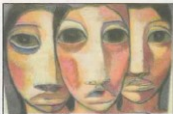
Une des toiles qui seront exposées à partir de lundi prochain

En 2004 il expose en France pour la première fois et en