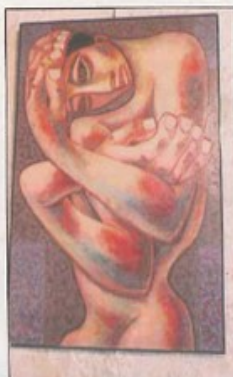
Les souffrances du monde