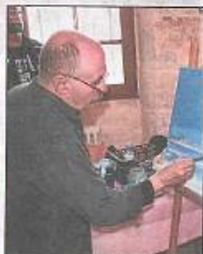
Le tableau commence à prendre forme au bout d'une trentaine de minutes