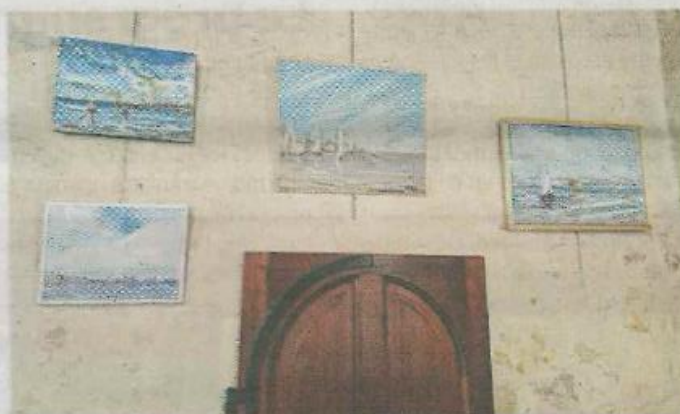
Les oeuvres de Jean-Pierre Plazas à l'Office du tourisme.

Jean-Pierre Plazas crée par la suite sa compagnie profession-