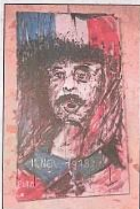
Heureusement la fin de la 2ème guerre mondiale est venu égayer cette série