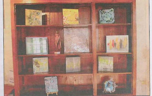
Des oeuvres d'un format plus accessible sont également exposées, ainsi qu'une de ses sculptures

Guyline Bisson peint depuis de nombreuses années, mais ce n'est que depuis 2013, qu'elle expose soit en solo, ou en groupes.