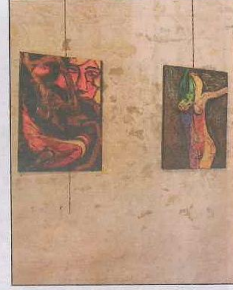
Elle revient de temps à autres au figuratif ou s'en rapproche

avec une artiste peintre à Montréal que l'artiste a évolué au niveau des techniques, de la matière, et des compositions, qui lui laisse une totale liberté de création. Sa matière de prédilection demeure l'acrylique qu'elle aime travailler avec de la matière, des pigments, des liants ou autres produits.