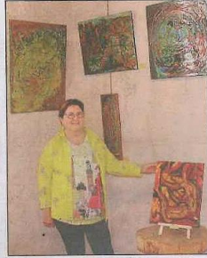
Les toiles de Guyline ressemblent à s'y tromper à des céramiques

C'est dans les années 2010, après une rencontre